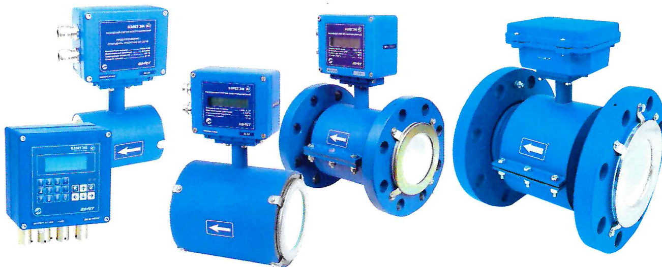
Рисунок 1 – Общий вид расходомеров-счетчиков электромагнитных «ВЗЛЕТ ЭМ»

Общий вид расходомеров-счетчиков электромагнитных «ВЗЛЕТ ЭМ» представлен на рисунке 1.