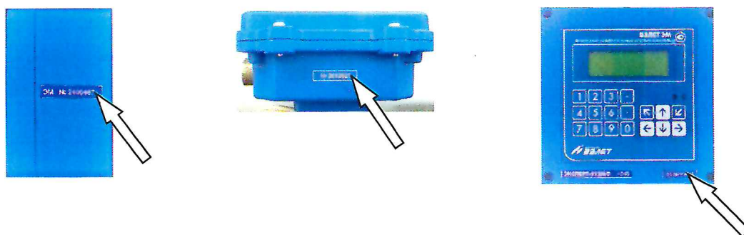
Рисунок 3 – Обозначение места нанесения заводского номера